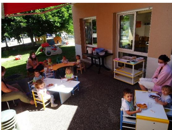
Repas dans le jardin