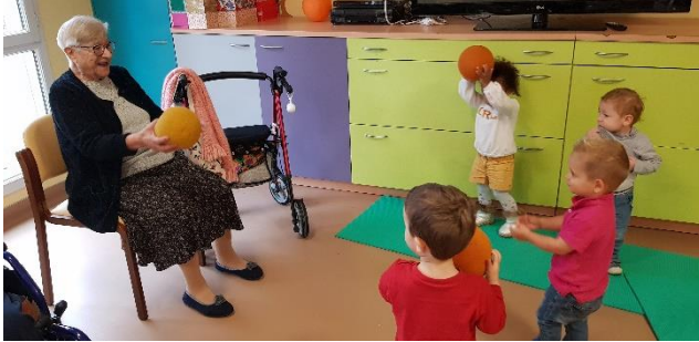
Jeu de ballon chez les Papys Mamys