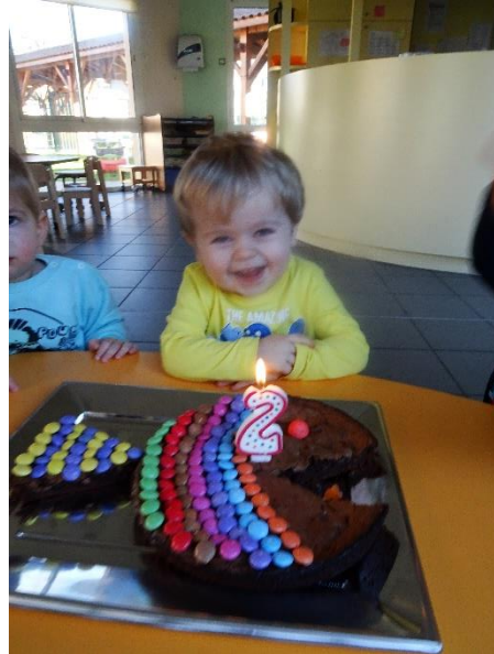
Swan : 2 ans