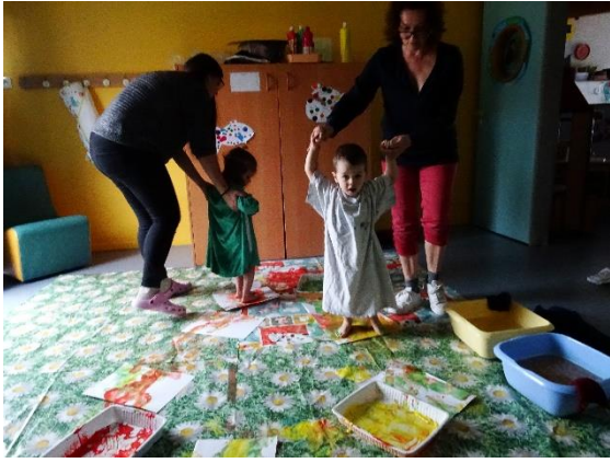
Peinture à pieds