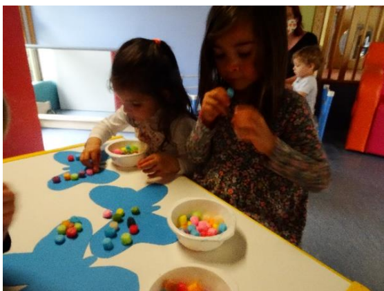
Décoration de papillons