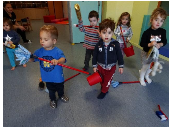
Vive le ménage !