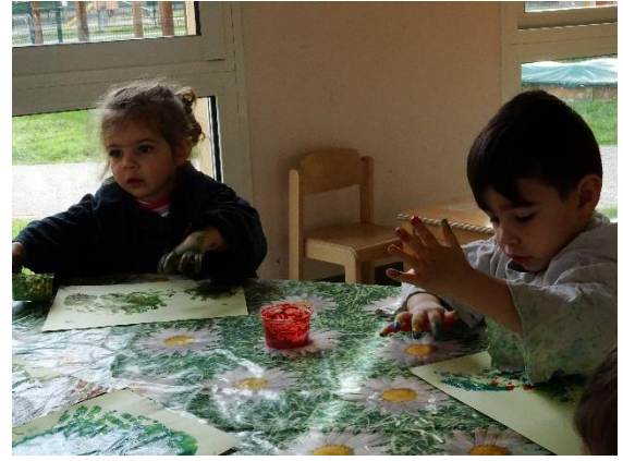
Peinture à mains