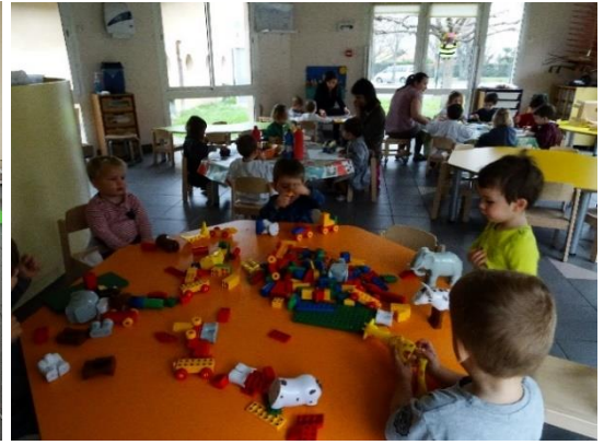
Activités dites dirigées