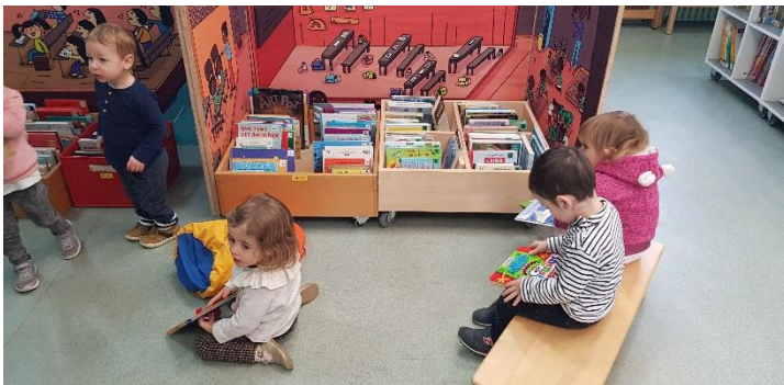
À la bibliothèque !