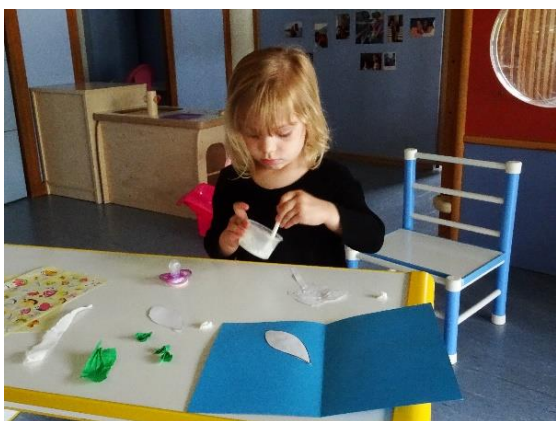
Un brin de muguet !