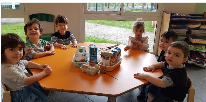
Pâte à crêpes