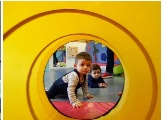
Chez les Loustiques